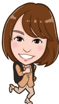
ますい あき 増井 亜喜